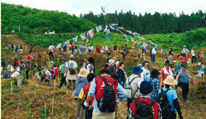
森は海の恋人植樹祭